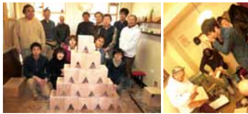
◀みんなで作りました!

東横堀川の水辺のオーダー家具店『うたたね』さんと、「どこでもベンチ」の製作ワークショップを開催。みんな木の削りカスまみれになりながらも、無事完成!