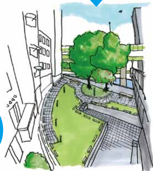
▲川とまちと橋がつながった水辺の公園(将来イメージ)