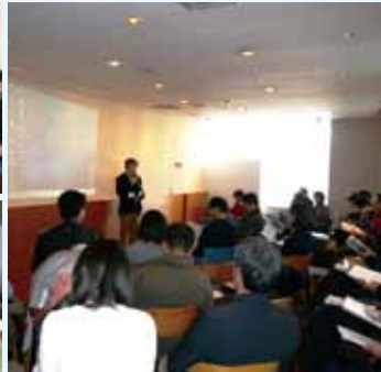
▲最後は参加者全員で“大阪締め”