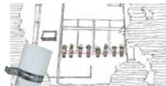
◀フラワーポット試作品