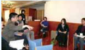
▼舟の話で盛り上がる

水辺活用の先進地域の東京・広島からゲストをお招きし、今年度のe-よこ会の活動報告をしながら、これからの東横堀川の水辺活用についてディスカッションしました。どちらかというところ“ハード先行型”だった大阪の水辺の取り組み。これからは、市民が自ら「どういう水辺にしていきたいか」を考え、その実現に向けて取り組んでいこうと、ご参加いただいた水辺の活動団体や専門家とともに想いをひとつにしました。