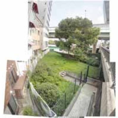
▲フェンスで囲まれた公園(現状)